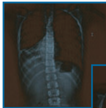
Antes de la fisioterapia.

La Clínica FISIOPULMONAL, con varios años de experiencia, garantiza la máxima calidad asistencial y un equipo de profesionales especializados en su problema respiratorio.