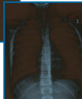
Después de la fisioterapia.

CONSULTE A SU MÉDICO O ESPECIALISTA en recibir en el tratamiento integral de su patología respiratoria un programa actual de técnicas en Fisioterapia Respiratoria